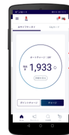
おサイフケータイ